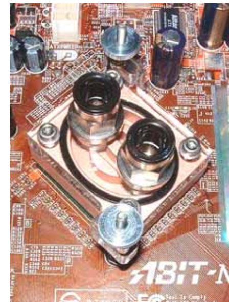
Abbildung 5 – Fertig installierter Kühler

Ist nun alles ordnungsgemäß montiert, sollte das Endergebnis in etwa so aussehen (Abb.5):