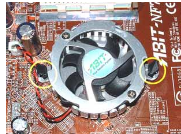
Abbildung 2 – Kühler mit Kunststoffdübeln

Standard - Northbridge-Kühler werden zumeist über simple Kunststoffdübel gehalten, die von vorne durch zwei Löcher in der Platine gesteckt sind. Zum Abnehmen des Standard-Kühlers muss man diese Dübel auf der Rückseite, wo sie sich aufgespreizt haben, vorsichtig mit einer Zange so zusammendrücken, dass man sie wieder durch die Löcher zurückschieben kann. Danach kann man den Kühler einfach abnehmen und das zugehörige Stromkabel abstecken.