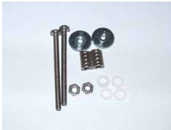
Abbildung 1 - Einbaumaterialien

Der Wasserkühler Modell „Heat-Trap NB Revision 1.1“ ist ein Qualitätsprodukt. Beim Einbau sollten sie daher ebenfalls auf ausreichende Sorgfalt achten, um nicht versehentlich teure Hardware oder ihren Wasserkühler zu beschädigen! Legen sie sich daher vor Beginn alle notwendigen Utensilien zurecht und übereilen sie nichts. Die notwendigen Bauteile für die Montage des Kühlers sind wie folgt: