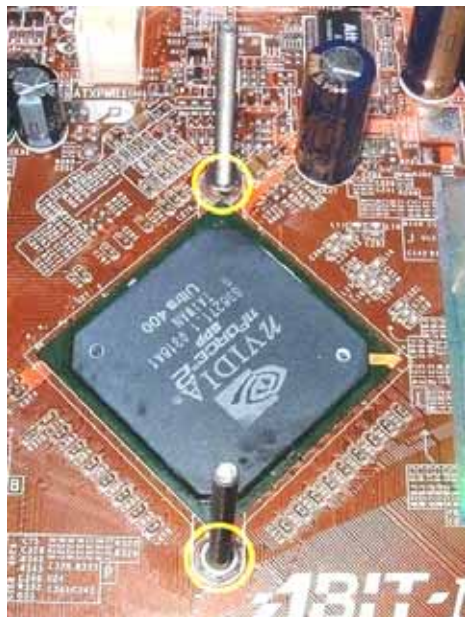
Abbildung 4 – Vorderseite der Platine mit eingesetzten Schrauben

Ist das geschehen, wird das Motherboard vorsichtig gewendet. Nun wird auf der Vorderseite ebenfalls eine Distanzscheibe über jede Schraube gesteckt und mittels der Sechskantmutter (nur leicht per Hand angezogen!) die Schraube fest mit der Platine verbunden. Das Endergebnis sollte in etwa wie folgt aussehen: